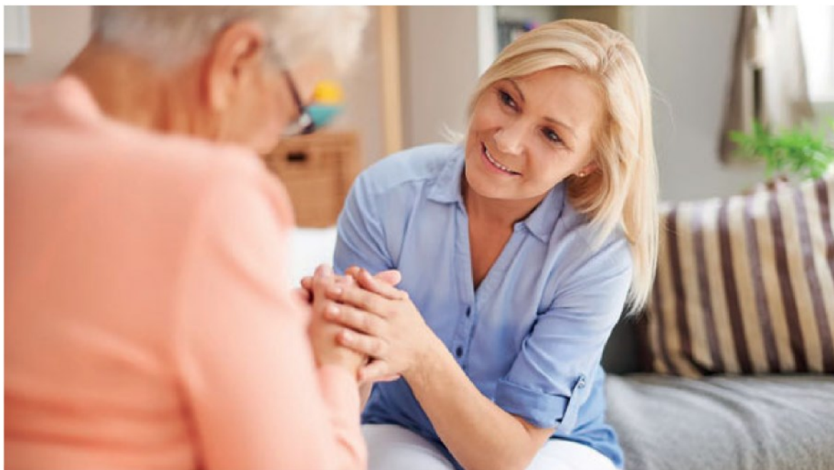
CON L'ASSISTENZA DI MBA IL TEMPO PASSATO CON I PROPRI CARI SARÀ SEMPRE PRIVO DI PREOCCUPAZIONI

scheletro, caratterizzata da una ridotta massa ossea e dal deterioramento della microarchitettura del tessuto osseo, con conseguente aumento della fragilità e predisposizione alle fratture. Con l'invecchiamento progressivo della popolazione, il rischio di avere sempre più persone che ne soffrono è concreto; per questo è importante prevenire il suo corso utilizzando integratori al collagene.